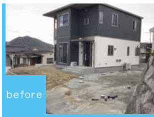
シミュレーション画像