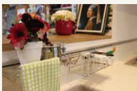
シンクもカラー人造大理石製。奥行きもたっぷりゆったり洗物ができます。

ユニオンスクウェアカフェの敷地内にあるユニオンリフォームのショールーム、“UNIONCUBE”。メーカーのショールームまで行かなくても焼山で最新の商品を見ていただきたいから、ユニオンキューブでは年に数回展示をリニューアルしております。今日はどんな展示があるのか、お散歩がてらやユニオンスクウェアカフェでのランチのついでに是非覗いてみてください。