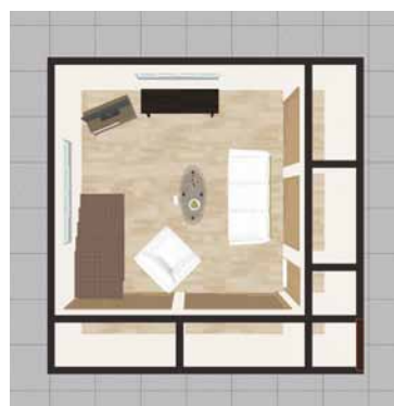
シミュレーション画像

すっきりしたりリビングに収まった本当に必要なモノと、素敵に飾られた大切なモノの数々がお二人の充実した暮らしを物語っているようです。