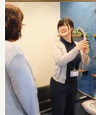
平日はアドバイザーがご説明♪