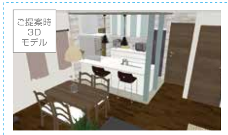
ご提案時 3D モデル